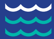
Dissalazione acqua marina