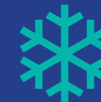
Ventilazione/ condizionamento dell'aria